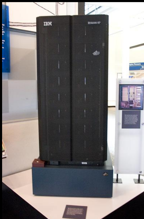
IBM Deep Blue